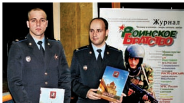
В добрый путь! 5