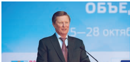
Новые подходы к военно-патриотическому воспитанию 2