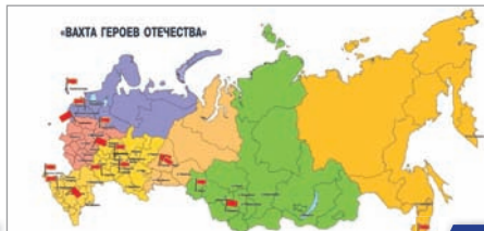
«ВАХТА ГЕРОЕВ ОТЕЧЕСТВА» Российская Ассоциация Героев 4