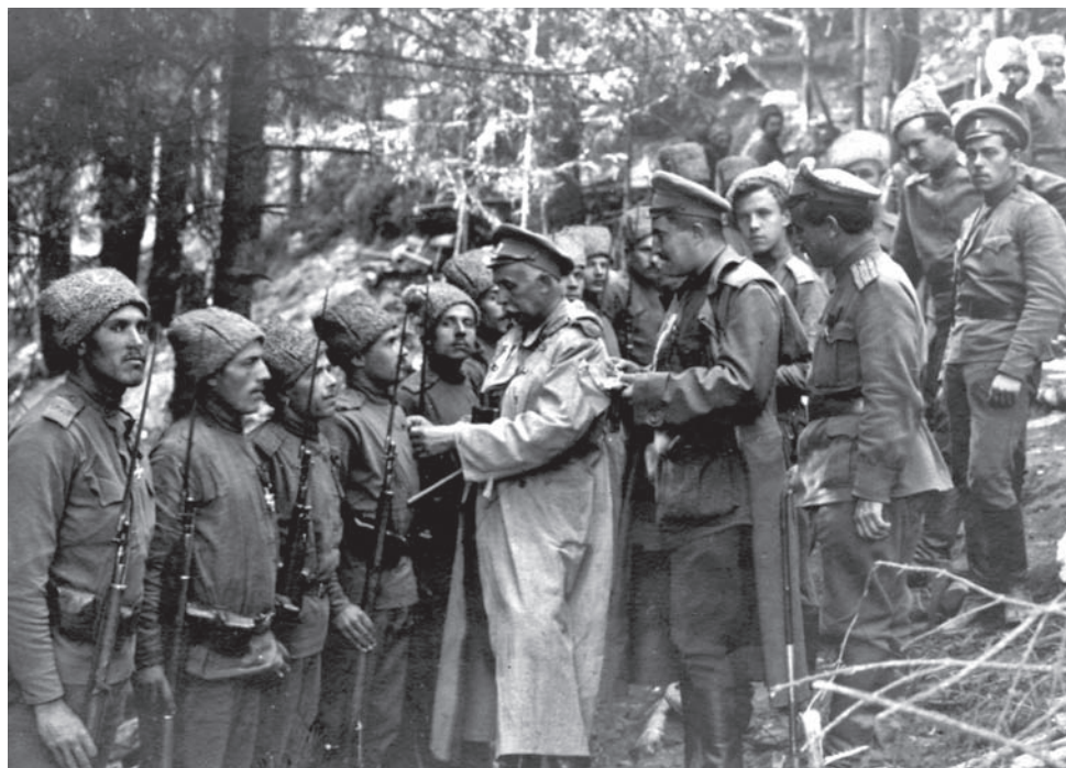
Награждение отличившихся 26.10.1916