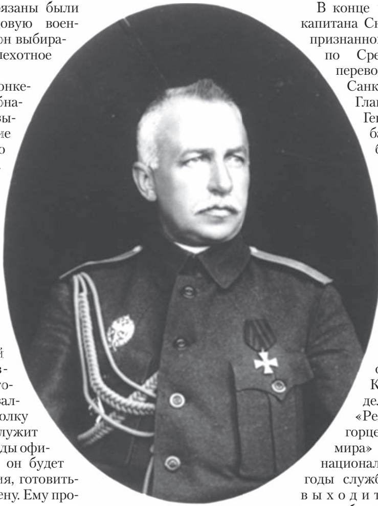
А. Е. Снесарев 1917 г.

У читателя «Вестника Героев» может возникнуть естественный вопрос: почему личные письма с фронта любящего мужа своей жене так привлекают общественное внимание. Во-первых, они принадлежат выдающемуся военному мыслителю. В них россыпь золотых мыслей о войне, военном искусстве, качествах воина и военачальника, революции и реформах, переменах в психологии наро-