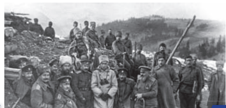
Первым Героям Державы посвящается... 8