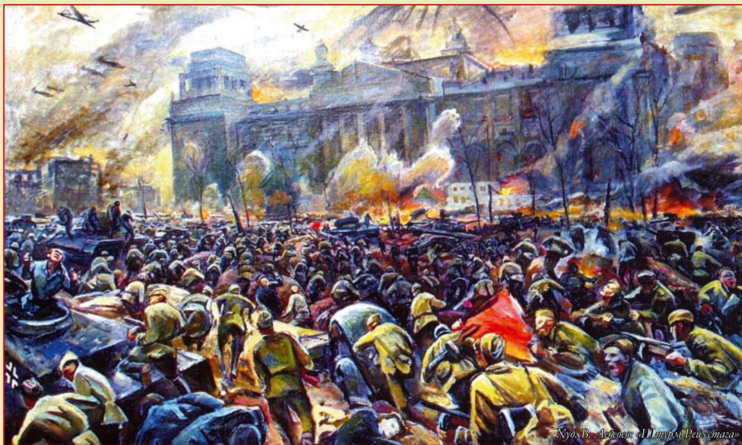
Худ. В. Лебедев «Штурм Рейхстага»

гвардии старший сержант, заслуженный художник России