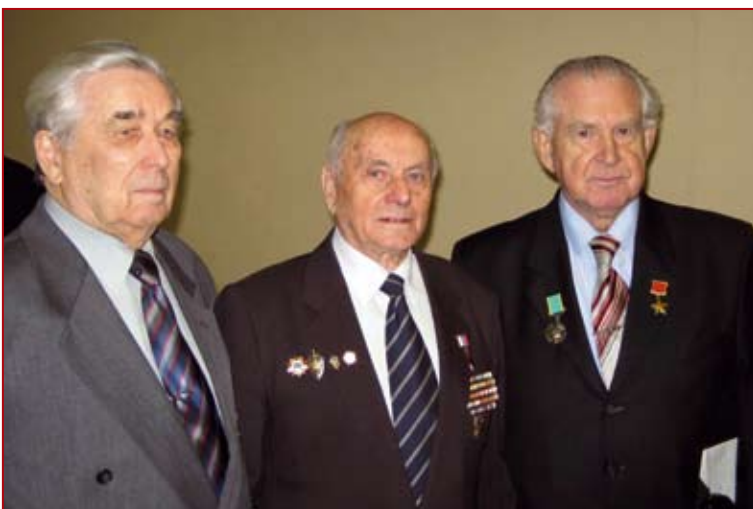
Герой Советского Союза С.Н. Решетов, Герой России А.Н. Ботян и Герой Советского Союза С.Д. Романовцев

АНО «Редакция газеты «Вестник Героев» БАНК «СОФРИНО» г. Москва р/счет 4070381010000000027 Кор.счет 3010181080000000375 БИК 044525375, ИНН 7730182885 КПП 773001001