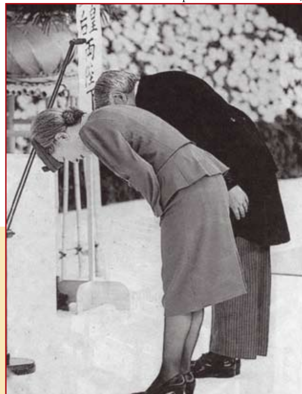
На фотографии — императорская семья оказывает честь жертвам войны (г.Токио).

Япония просит прощения за ущерб, нанесенный во время II мировой войны (газета «Эль паис», 16 августа 2005 г.) — перевод Т. П. (Специалисты сразу отмечают, что они демонстрируют самый низкий, а значит — уважительный поклон).