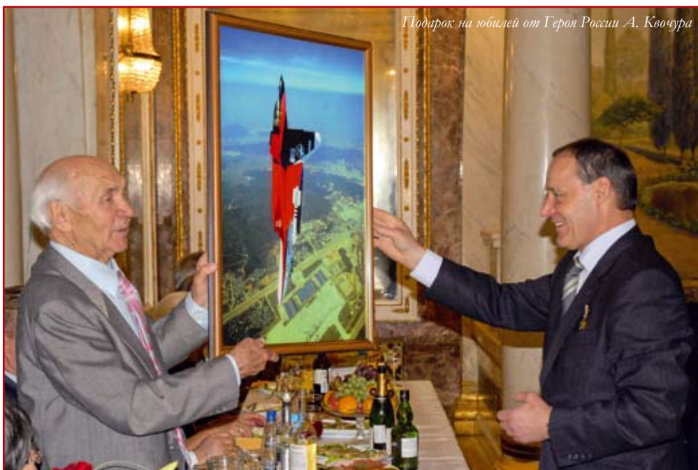
Подарок на юбилей от Героя России А. Ковчура