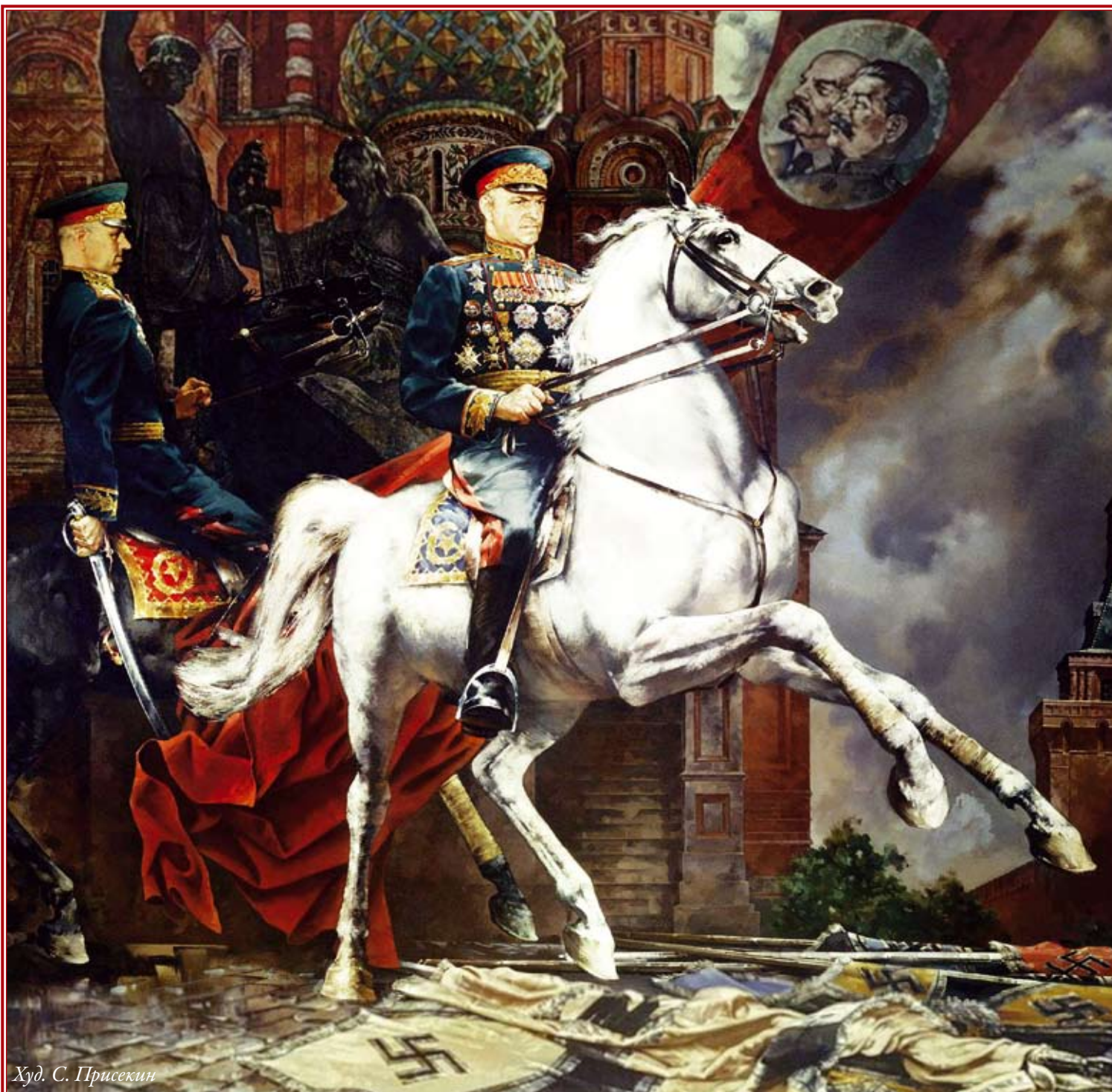
Худ. С. Присекин