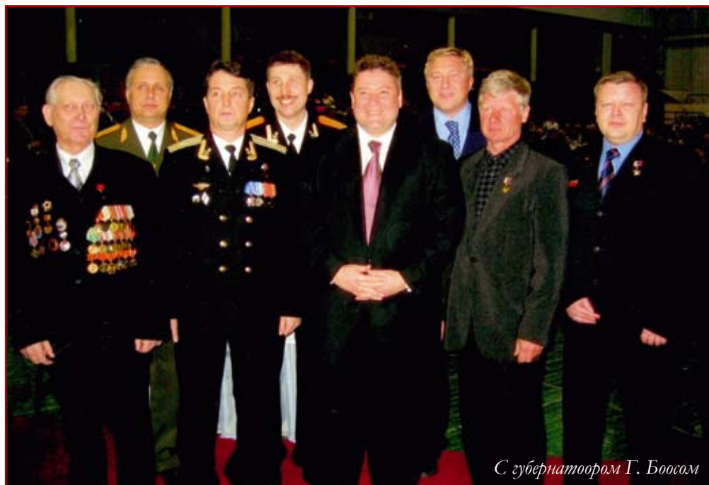
С губернатором Г. Боосом

Не забывают Героя Российской Федерации, живущего и работающего в глубинке, ни в Москве, ни в Калининграде. Все эти годы в его день рождения, 23 февраля, приходят поздравительные открытки за подписью Пре-