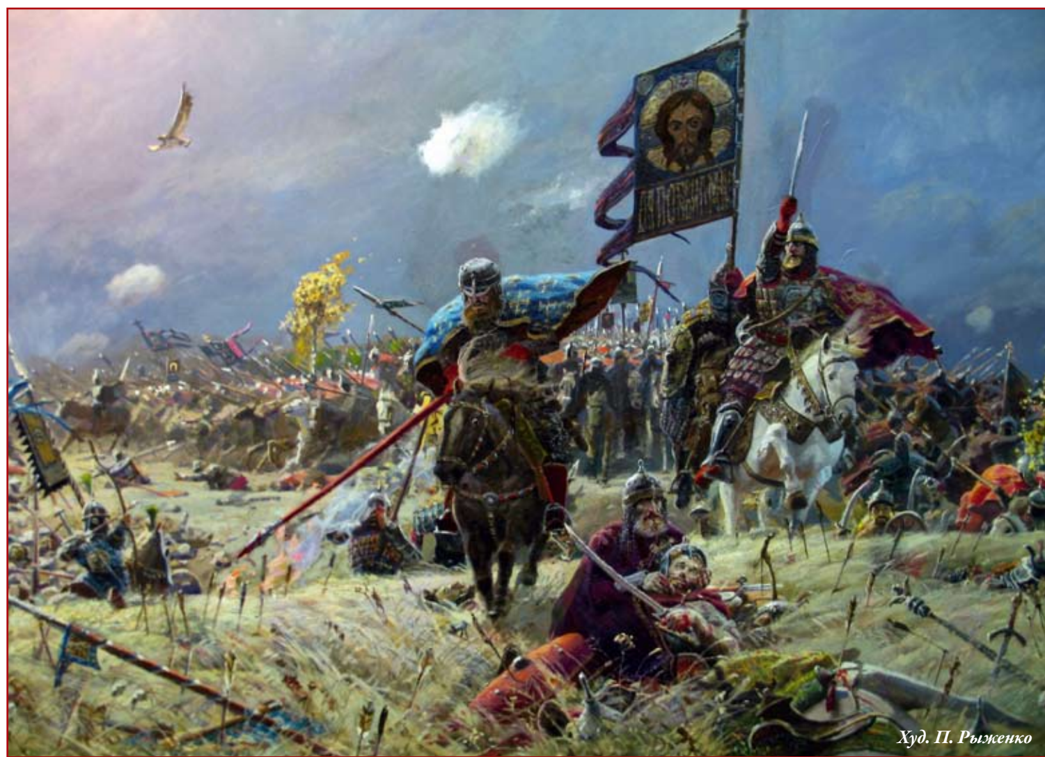
Худ. П. Рыженко