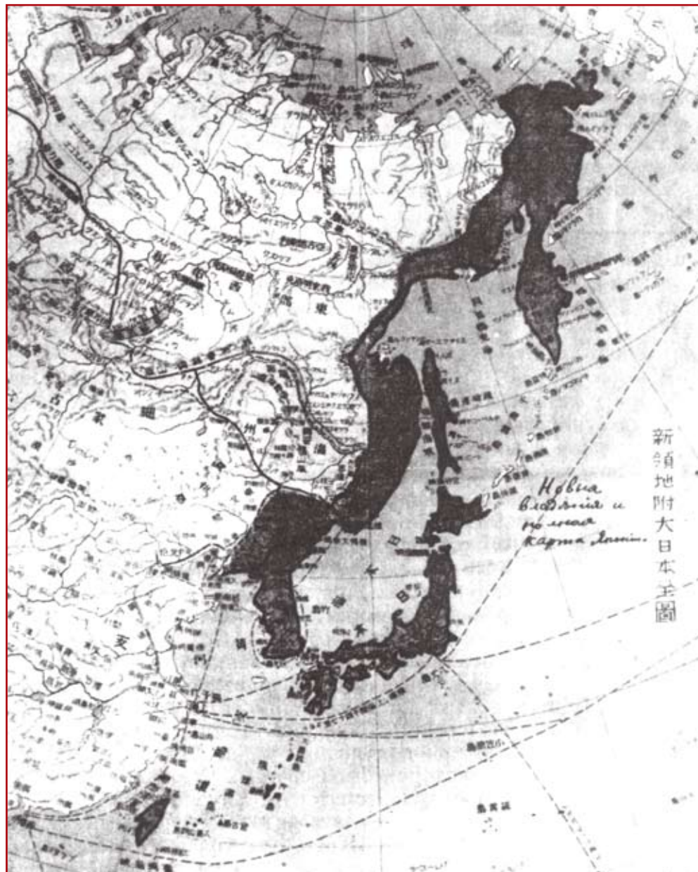
Документ № 24. Карта «Новые владения и полная карта Японии» издана в Японии в 1910-х гг. Источник: АВПРИ, ф. Японский стол, д. № 966, л. 27