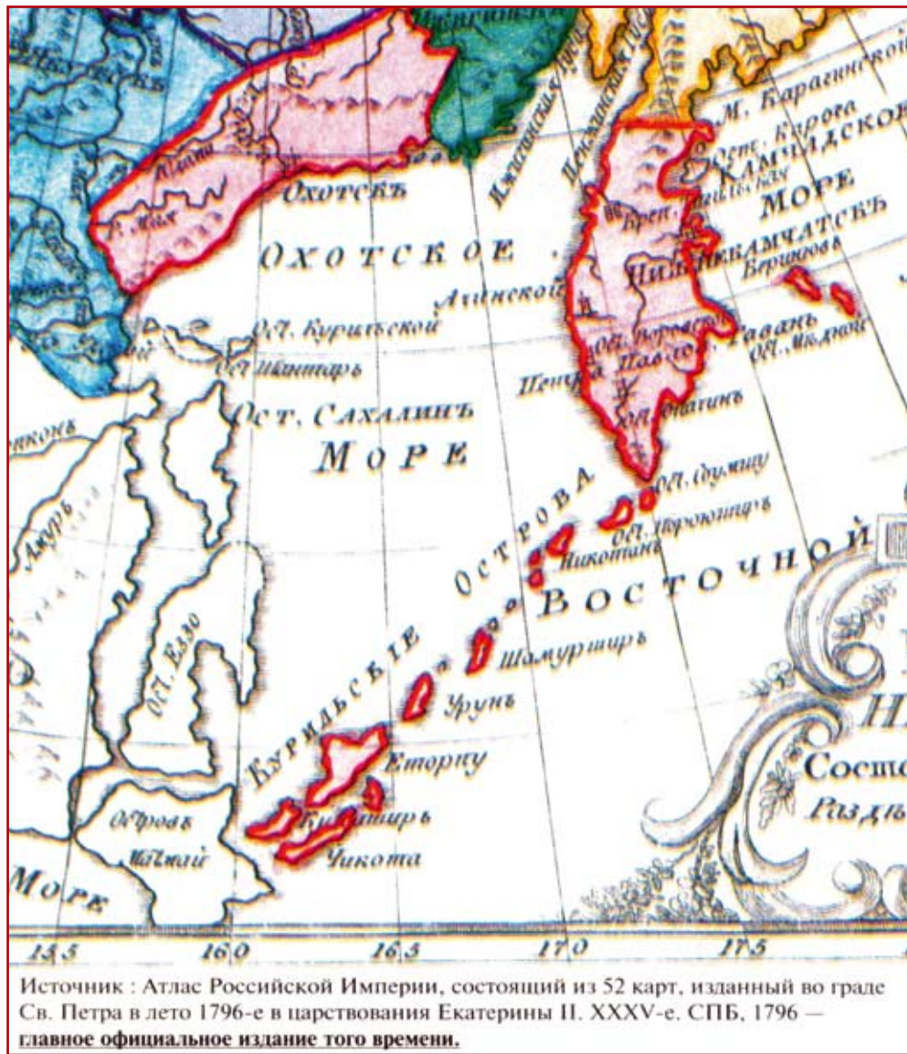
Фрагмент из документа № 5 «Карта Иркутского Наместничества состоящая из 4 областей, разделенных на 17 уездов». 1796 год.

вило, японские политики обращаются к этой теме в тех случаях, когда требуется отвлечь внимание нации от внутренних проблем. Активно используется эта тема и в ходе предвыборных кампаний, а также для того, чтобы в сознании рядового обывателя сформировался негативный имидж России. Дело доходит до того, что сомнению подвергается право Президента Российской Федерации Д.А. Медведева посещать эти территории. Что лежит в основе этой активности? И почему эта тема до сих пор является серьезным раздражителем не только в формате двусторонних отношений, но и привлекает внимание других держав?