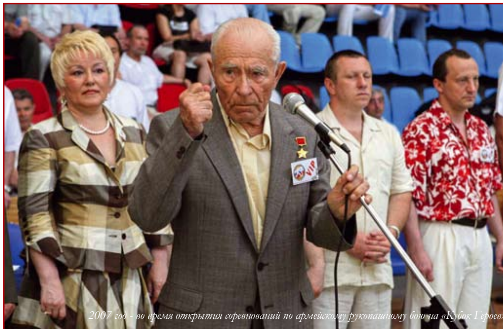
2007 год - во время открытия соревнований по армейскому рукопашному бою на «Кубок Героев»

И подчиненных, используя любую возможность, офицер учил премудростям единоборства с врагом. «Война показала, что без рукопашного боя никуда: как только ворвался в траншею, пошел по ходам сооб-