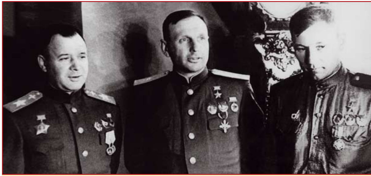
Слева-направо: А. Новиков, И. Антошкин, А. Покрышкин

да Клина, механизированные части и танки немецко-фашистских войск начали беспрепятственное продвижение к городам Солнечногорску и Москве из-за отсутствия наших войск на этом направлении. Чтобы закрыть создавшуюся брешь, на это направление были брошены основные силы авиации Западного фронта и Московского военного округа. Была привлечена и 77-я авиационная дивизия. Только за одни сутки боевых действий 27 ноября 1941 года, в сложнейших метеорологических условиях, авиация выполнила 1500 боевых вылетов и уничтожила: до 100 танков, более 600 автомашин с грузами и боеприпасами, большое количество солдат и офицеров. Полки 77-й авиационной дивизии с 28 ноября по 1 декабря 1941 года выполнили 243 боевых вылета в направлении городов Клин и Солнечногорск. Фашистские войска были остановлены на этом направлении. Они несколько суток убирали с дорог трупы своих солдат и офицеров, расчищали их от уничтоженной и поврежденной техники. Немецкие солдаты назвали эту дорогу «Дорогой смерти».