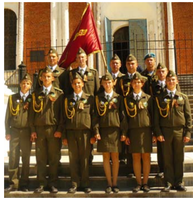
Победитель Финала — команда из Волгограда

Вице-губернатор сказал: мы горды тем, что Рязани оказана такая честь. И это сказал Герой России, выпускник Рязанского училища!