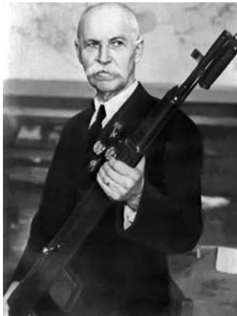
Конструктор стрелкового оружия Ф.В.Токарев в артиллерийском историческом музее РККА с автоматической винтовкой своей конструкции

В довоенные годы таких объемов не знал ни один оружейный завод СССР.