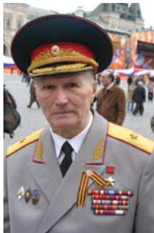
Геннадий Николаевич Зайцев,

Герой Советского Союза, легендарный руководитель группы «А»