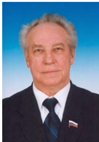
Николай Сергеевич Леонов, генерал- лейтенант