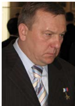
Владимир Анатольевич Шаманов, Герой России, Президент Российской Ассоциации Героев, начальник Главного управления боевой подготовки и службы войск Вооруженных Сил РФ

Развернув сформированные группировки, в том числе и реактивные системы залпового огня, режим Саакашвили начал боевые действия с боевого поражения жилых кварталов города Цхинвала, а также по позициям миротворцев. А то кошмарство, которое после этого акта агрессии развернулось в западных и заокеанских СМИ, то, с каким изощрением пытались вылить грязь на Россию, просто поражает сознание. Мир в очередной раз убедился, насколько может быть опасен однопо-