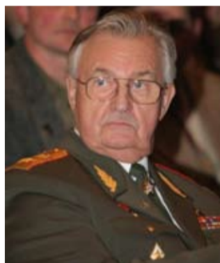
Валентин Иванович Варенников, Герой Советского Союза

Для того, чтобы воспитать человека, гражданина, патриота, важно все: чтобы любил свою Родину, свою семью, свой край, все, что связано с местом его рождения и жизни. Даже патриотические проявления граждан во время спортивных батальонов очень важны и поучительны, я уже не говорю о каких-либо масштабных для государства явлений, будь то полет в космос или погружение в глубины океанов. Все эти свершения — предмет для гордости и проявления патриотических чувств граждан того государства, в котором такие явления происходят. Для государства важно, чтобы проявления таких патриотических чувств начиналось у наших граждан как можно с более раннего возраста. Значит само государство должно позаботиться о том, чтобы каждый гражданин мог в достатке получить такое воспитание по мере своего развития, чтобы у него был шанс стать настоящим гражданином — патриотом своей Родины. Но мы знаем, что такое воспитание никак не отделимо от состояния социальных вопросов в обществе и государстве, что называется: «в здоровом теле — здоровый дух!». Давайте посмотрим на нашу сегодняшнюю молодежь, например на призывников. Если из тех ребят, которые призываются сегодня в Армию из 20 человек мы найдем пятерых здоровых людей, то это будет скорее исключением, чем закономерностью. В основном призывники сегодня имеют не самый «здоровый» вид — все какне-то синенькие, дохленькие и т.п. Ну и скажите, пожалуйста, о