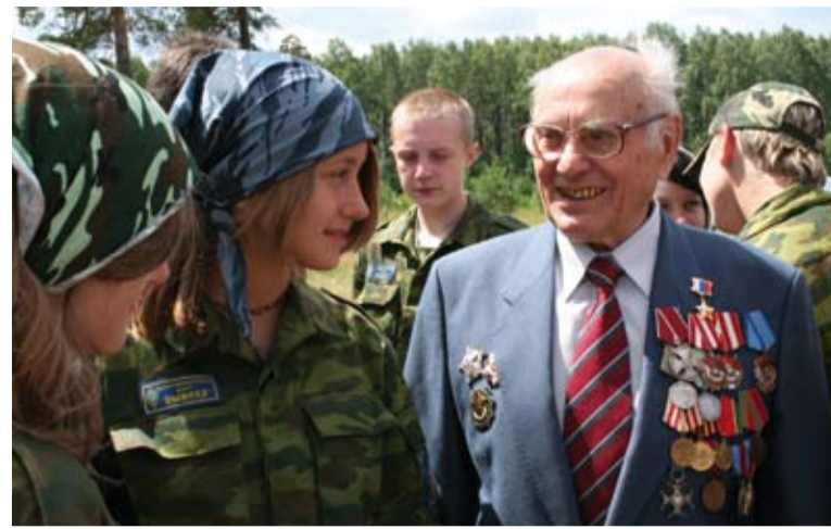
Герой России А.Н. Ботян

сложности, в условиях дикого леса ребята учатся самостоятельно мыслить и принимать нестандартные решения, выживать и ориентироваться, не теряться в экстремальной ситуации. Они учатся защищать себя и своих близких, получают навыки альпинистской, водной, стрелковой и даже воздушной подготовки, становятся способными в нужный момент оказать первую медицинскую помощь, расширяют свой кругозор