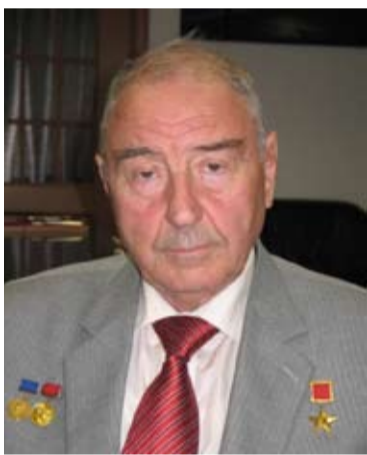
Олег Дмитриевич Бакланов, Герой Социалистического Труда

Сергей Александрович Афанасьев отдавал все свои силы становлению и развитию ракетно-космической промышленности, исследованию и освоению космоса.