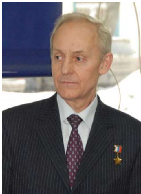
Несфедов Сергей Иванович, Герой России

Что нужно для жизни? Для жизни нужно всего 4 условия: воздух, вода, тепло и пища. Отсутствие любого из них делает нашу жизнь невозможной. Никто не ставит вопрос: что нужно для продолжения жизни? Но с точки зрения диалектики именно дети — условие продолжения нашей жизни! Это условие продолжения нации, подчеркиваю, не государства. Это определенная общность на земле, которая сама по себе формирует и национальность, и нацию, и государство, и родину, и отечество. Мы сами перевернули ценности жизни в потребительскую категорию. Наши дети сегодня, рождаясь биологически, погибают физически и нравственно в той системе, в которой им сегодня приходится находиться. Вот мы сегодня говорим о том, что дети по чердакам сидят, алкоголиками становятся, матерятся, но ведь это следствие, а причина в чем? Причина в безответственном отношении общества, нации, государства и отчества к своему продолжению жизни. Это значит, что мы потеряли элементарное чувство самосохранения, элементарное чувство выживания нации, а это влечет за собой и дальнейшее разрушение: падение нравственного состояния, национального самосознания, правосознания и прочего сознания, которое формирует не только человеческий облик, но и поступательное движение его в жизни.