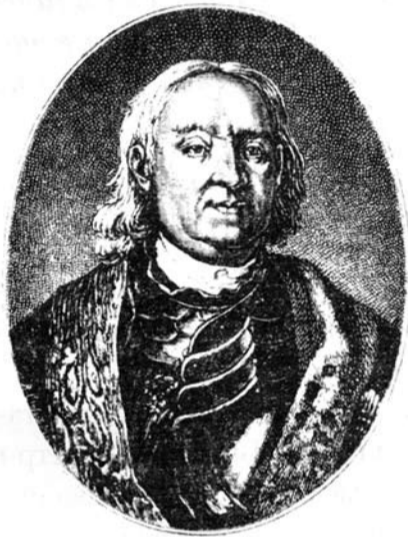
Федор Матвеевич Апраксин

Адмирал Ватранг, узнав о работах на «переволоке», разделил свою эскадру и 25 июля послал отряд из 10 шхерных судов под начальством Эреншильда к западному берегу п-ова, с тем чтобы помешать перегаскиванию русских галер, и отряд из 14 кораблей под командованием Лиллье к Твермине для нападения на русский галерный флот.