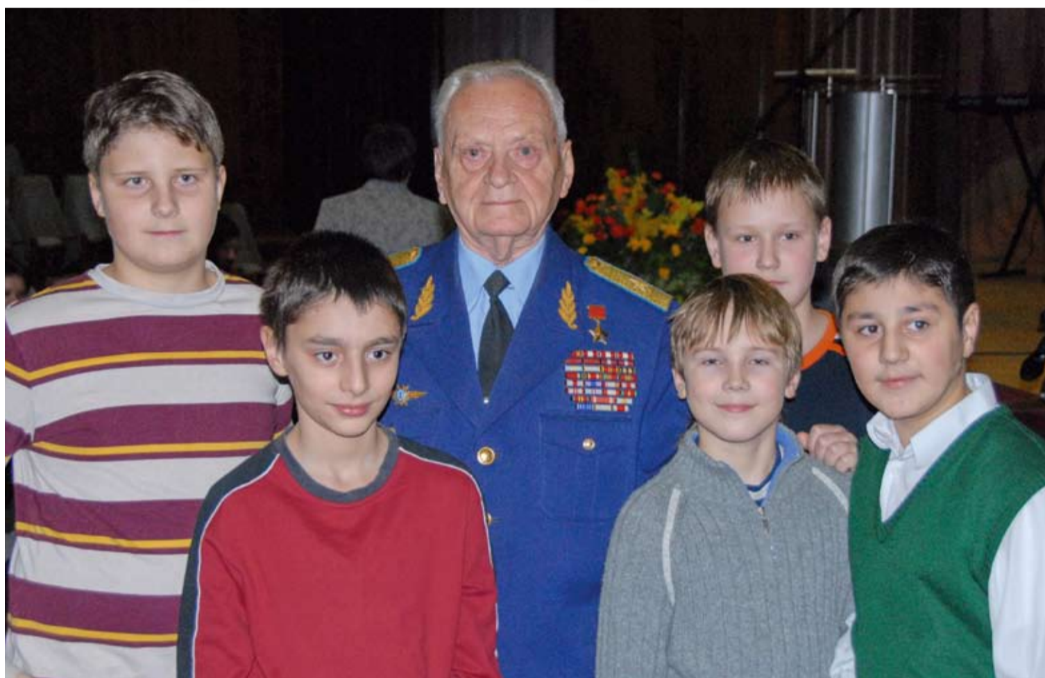
Герой Советского Союза И.И. Лезжов (85 лет) с московскими школьниками

В.А. Шаманов. Россия остановила агрессора (Стр. 8)