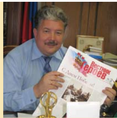
Сергей Николаевич Бабурин

Очень важно, что Россия сумела защитить своих граждан, остановила агрессора и восстановила свое доброе имя, как в былые времена. Однополярный мир исчерпал свои ресурсы. Российская Армия готова поддерживать славные традиции наших предков по защите своих границ, интересов, а также, оказывая помощи дружественным нам народам.