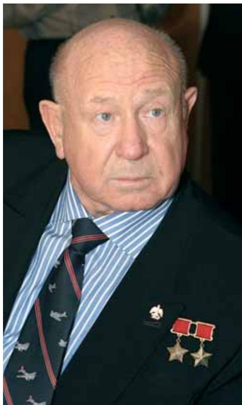
Алексей Архипович Леонов Дважды Герой Советского Союза Летчик-космонавт

12 апреля 1961 года началась новая эра в истории цивилизации – эра пилотируемых космических полетов. 108 минут кругосветного путешествия, которое совершил Юрий Гагарин на борту космического корабля «Восток», потрясли весь мир. Этот подвиг мысли и труда наших соотечественников по праву вошел в летопись великих свершений человечества – как одна из самых ее ярких страниц. Юрий Гагарин сказал перед стартом такие слова: «Я испытываю большое счастье – быть первым в космосе. Как это фантастично – вступить в небывалый поединок с природой – один на один! Можно ли мечтать о большем? 27 марта исполнилось ровно 40 лет со дня трагической гибели первого космонавта Земли.»