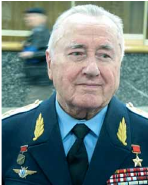
И.И. Пстыго Герой Советского Союза Маршал авиации Заслуженный военный летчик СССР

Для моего поколения Герои-Челюскинцы были настоящими кумирами. Они были общепризнанными Героями. Во-первых, во всех учреждениях после знаменитой эпопеи на стенах висели портреты всех семи Героев, конечно же, в строгой субординации по отношению к портретам вождей страны. И я вам скажу, что это обстоятельство имело огромное воспитательное значение. Поверьте, я знаю что говорю, и имею на это полное право, не только потому, что я — Герой Советского Союза, а потому что мне уже исполнилось 90 лет. Сегодня мы имеем колоссальный провал в героико-патриотическом воспитании современной молодежи — ведь прак-