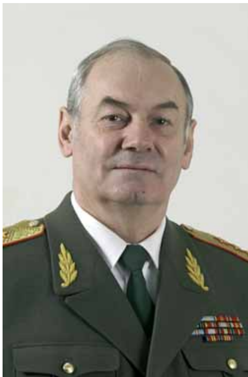
Ивашов Леонид Григорьевич Генерал-полковник Президент Академии Геополитический проблем

Как следует оценивать возможное вступление в НАТО Украины и Грузии. Возможно ли говорить о начале новой «холодной войны»?