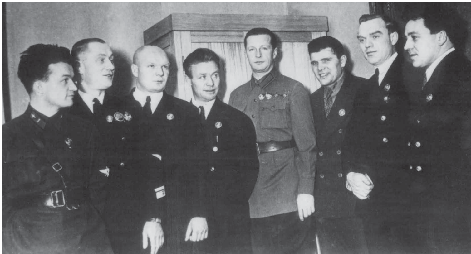
Герои Советского Союза (слева направо): Н.П. Каманин, М.Т. Слепнев, И.В. Доронин, В.С. Молоков, М.М. Громов, М.В. Водопьянов, С.А. Леваневский, А.В. Ляпидевский.

После того, как он доставил спасенных в Уэллен, резко испортилась погода, началась пурга. Он каждый день пробовал вылететь, но каждый раз возвращался, то из-за погоды, то из-за неисправности двигателя. Ляпидевскому удалось совершить очередной вылет только 14 марта. Во время очередного полета, прямо в воздухе, лопнул коленчатый вал двигателя, двигатель затарахтел и самолет, завалившись на бок, затрясся. Ляпидевский совершил вынужденную посадку среди льдов в районе острова Колючина в 15 км от Чукотского селения, получив при этом дополнительные повреждения (сломалась лыжа