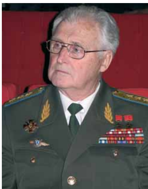
М.П. Одинцов Дважды Герой Советского Союза Первый вице-президент «Российской Ассоциации Героев».

20 марта 2008 года исполняется 16 лет со дня учреждения звания Герой Российской Федерации, это знак особого отличия, с вручением Золотой Звезды за особые подвиги.