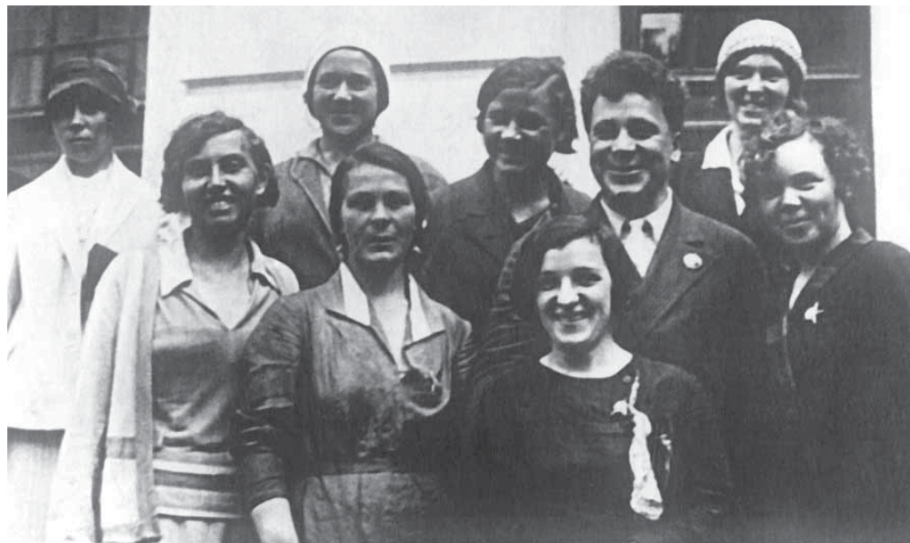
Летчик Ляпидевский в группе спасенных им женщин-участниц экспедиции на «Челюскине».