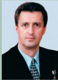
65 лет (8.10) Герой Российской Федерации МАЛАХОВ Михаил Георгиевич