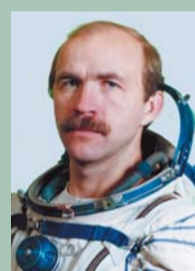
65 лет (30.10) Герой Российской Федерации ПОЛЕЦУК Александр Федорович