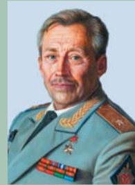
65 лет (19.10) Герой Советского Союза СОКОЛОВ Борис Иннокентьевич