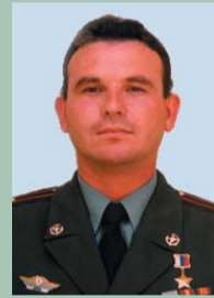
55 лет (27.10) Герой Российской Федерации КЛУПОВ Рустем Максович