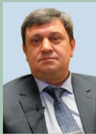
50 лет (13.10) Герой Российской Федерации КОНЮХОВ Иван Иванович