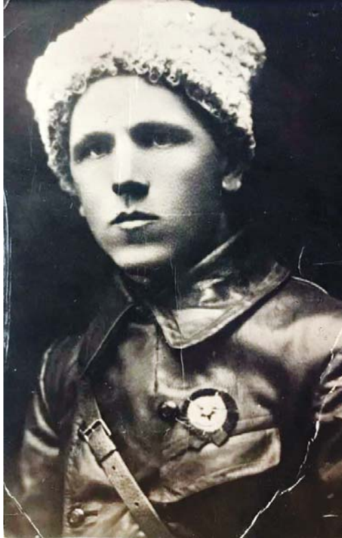
А.В. Горбатов — красноармеец

Горбатов был освобождён весной 1941 года — в период, получивший у историков название «предвоенной оттепели». Оказавшись на фронте перед лицом злейшего врага, он сумел подхватить в себе личные обиды, так как в первую очередь думал о судьбе Отечества. По характеру Горбатов был предприимчивый человек с долей соизидательного авантюризма, что всегда способствовало успеху. Именно с таким характером можно было побеждать сильного и хитрого врага, пренебрегая шаблонами. Неслучайно каждая операция, проведённая Горбатовым-полководцем, оказывалась ошеломляющей для противника. Например, в 1941 под Харьковом командир 226-й стрелковой дивизии Горбатов лично возглавлял батальоны полков, совершавших дерзкие набеги на немецкие гарнизоны, расположенные в сёлах на захваченной фашистами территории. Не от хорошей жизни отправлялся он в эти крайне опасные «партизанские» вылазки. Почти все комбаты в его полках (дивизию из-за тяжёлых потерь фактически пришлось формировать заново) были молодыми необстрелянными лейтенантами, поэтому комдив на собственном примере показывал, как необходимо действовать в боевой обстановке. Рядовые бойцы, одерживая одну победу за другой, приобретали не только боевой опыт, но и дух победителя, утраченный в обстановке тяжёлых поражений и потерь начального периода Великой Отечественной войны.