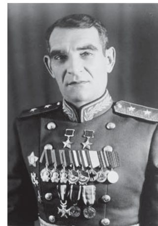
Глазунов Василий Афанасьевич

те 1945 года. Кюстрин – это ключ к Берлину, до которого всего-то оставалось сто километров. Фашисты создали там мощный укрепленный район. Глазунов вспоминал: «Под городом Кюстрином... мы взяли в плен одного немецкого офицера. Он ехал из Берлина, из германского генерального штаба, в гарнизон Кюстрина с приказом обороняться насмерть, раздав оружие даже местному населению... Привели его ко мне. Вижу – держится гордо, даже надменно. Угостил я его чаем, он размяк несколько и говорит: «Признаться, ни армия наша, ни население не верят больше в победу Германии. Но солдаты наши будут драться до последнего. Таков приказ, а мы, немцы, дисциплинированные солдаты!» Но и Кюстрин пал. А о падении Берлина и конце Третьего рейха первый командующий ВДВ напишет и вовсе лаконично: «К вечеру (30 апреля) пришли с белым флагом немецкий полковник, два офицера и переводчик и просили, чтобы мы приняли их начальника генерального штаба Кребса для важных переговоров...» Но до этого были почти четыре года страшных потерь и разрушений.