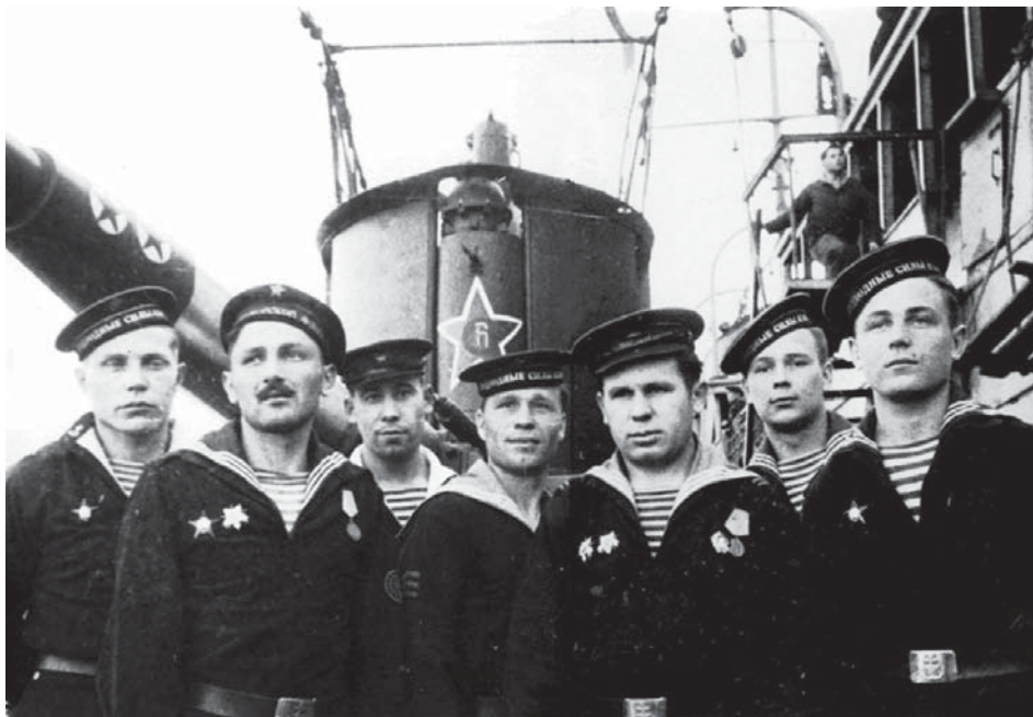
Члены экипажа советской подводной лодки С-13 (слева направо):