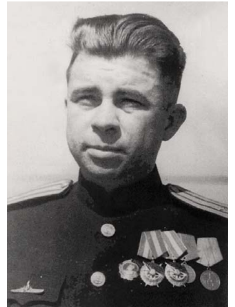
Капитан 3-го ранга Александр Иванович Маринеско, 1945 год

Итак, 9 января 1945 года подлодка С-13 Балтийского флота вышла в очередной поход. 30 января, примерно в 19 часов, командир лодки капитан 3-го ранга Маринеско увидел в перископ ярко освещённое немецкое судно, следовавшее из Готенхафена (ныне — Гдыня). Это шёл