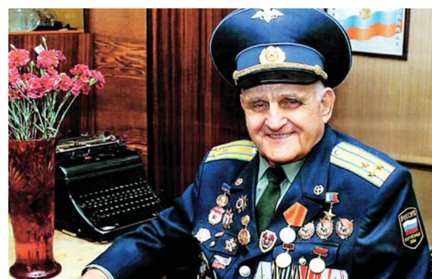
ВЕК НАСТОЯЩЕГО ЧЕЛОВЕКА