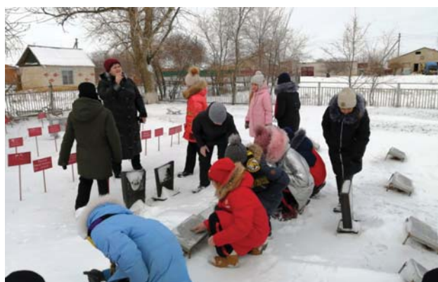
ПО МЕСТАМ ВОИНСКОЙ СЛАВЫ