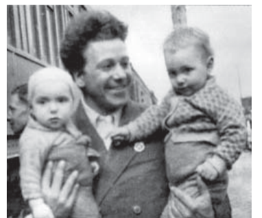
А. Ляпидевский со спасёнными девочками

мировых газетах тема спасения челюскинцев была вынесена на главные полосы: «Это один из величайших примеров героизма и выносливости, которыми так богата история арктических экспедиций»; «Благодаря советским лётчикам, благополучно