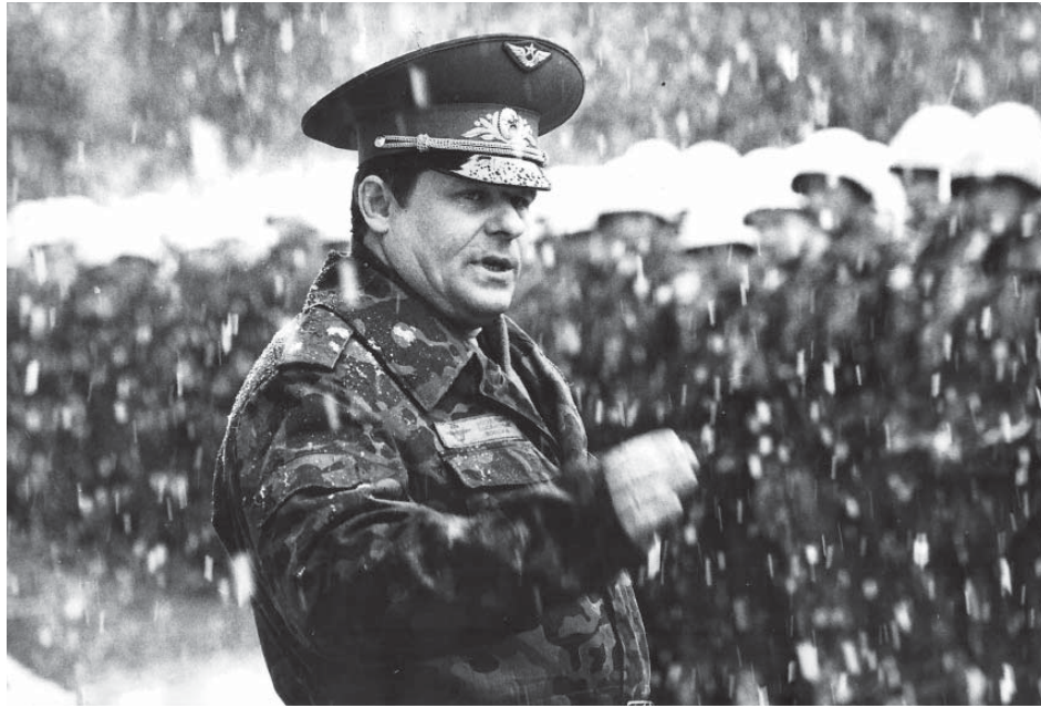
Генерал-лейтенант Н.В. Стаськов

Если говорить об Автономном крае Косово и Метохия в период 1999 года, то там назревал огромный конфликт на межрелигиозной и межнациональной почве. Косово и Метохия – исторический сербский край, издревле заселённый и обустроенный сербским народом, место зарождения сербской государственности, это колыбель православного христианства на Балкан-