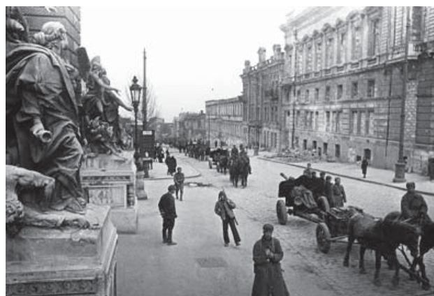
Одесса, апрель 1944