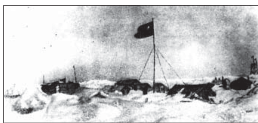
Лагерь Шмидта на льдине. 1934 г.

Молоков, Николай Каманин, Михаил Водопьянов вывозили людей на одномоторных самолётах Р-5, а Иван Доронин — на «Юнкерсе» W-34.